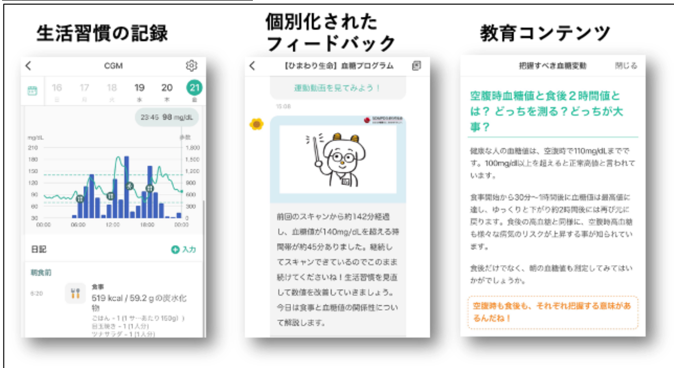
図1. スマートフォンアプリの画面

この2型糖尿病予防のためのスマートフォンアプリを含むプログラムの有効性を調べるために、3か月間のランダム化比較試験（注2）を行いました。本臨床試験には、糖尿病予備群（HbA1c5.6%～6.4%、空腹時血糖値110mg/dl～125mg/dl）で体重が多め（BMI 23Kg/m 2 以上）の方々179名が参加し、半分の方にのみこの新しい2型糖尿病予防・教育アプリを3か月間使用してもらい、使用しなかった残り半分の方と、血糖値、体重、食事摂取量、身体活動量などの改善度を比較しました。