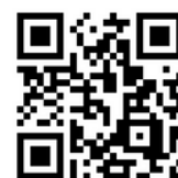
血糖測定後の自動同期手順